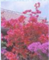
【市花】ブーゲンビレア 【市木】フクギ／Fukugi ／Bougainvillea