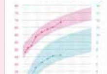
乳児身体発育曲線