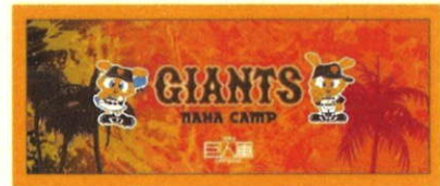
メガホン (640 円)