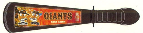
メガホン (640 円)