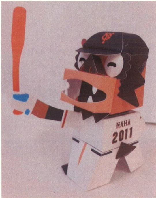
ペーパークラフトジャイアンツシーサー (380 円)