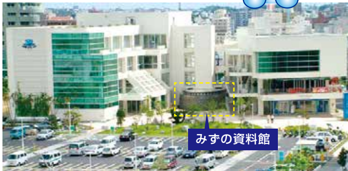
那覇市上下水道局庁舎

この施設は、見て・触れる展示物により水道や下水道について楽しく知ってもらうことができます。子供から大人まで楽しんでいただけますので、お気軽に遊びに来てください。