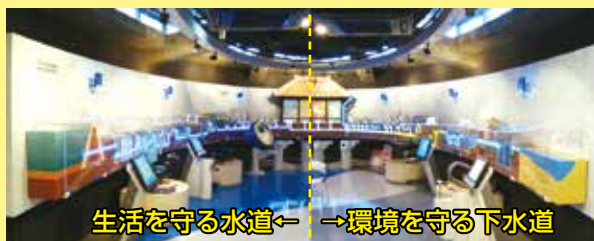
生活を守る水道 ← → 環境を守る下水道

自然の水を暮らしに利用できるように浄化する上水道事業の役割と設備について、操作体験や実物の観察を交えながら楽しく学習できるゾーン。