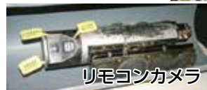
リモコンカメラで撮影された下水道管の中の様子