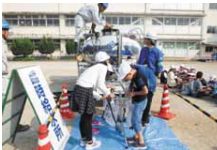
↑ 給水車による応急給水訓練