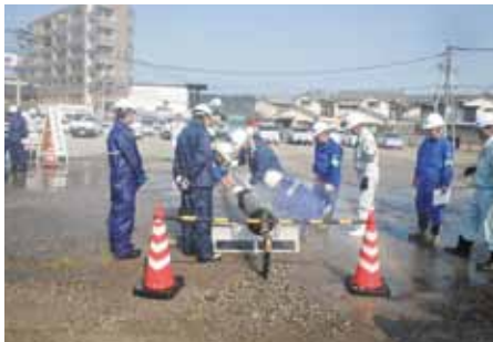
↑ 配水管修繕訓練 2