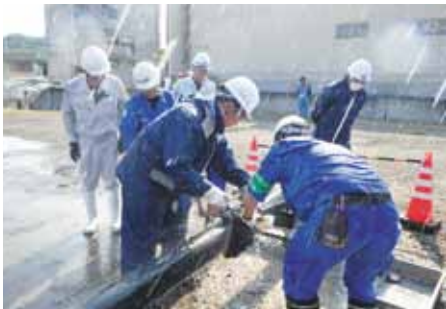
↑ 配水管修繕訓練 1

平成29年度日本水道協会九州地方支部合同防災訓練(in大分市) 九州・沖縄地方において大規模な地震が発生した場合の相互応援体制を確立するために、毎年度、日本水道協会九州地方支部による合同防災訓練が実施されており、平成29年度は大分市で開催され本市上下水道局からも危機管理体制強化を目的に職員が参加しました。