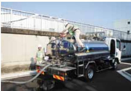
↑ 給水車水道水補給訓練