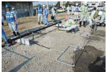
↑ 仮設給水栓設置訓練