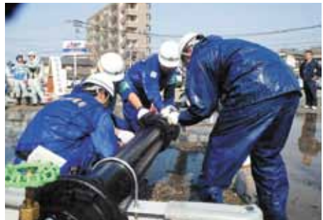
↑ 配水管修繕訓練 3