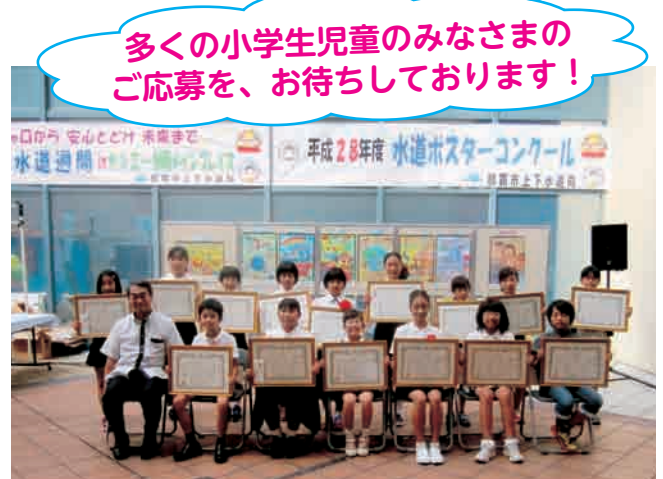
↑ 平成28年度 表彰式の様子

応募者全員に参加賞を差し上げ、入賞者には賞状と副賞として図書カードを贈呈します。