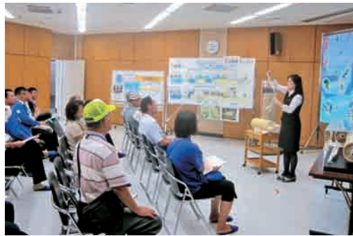
↑ 海水から真水を作るしくみにびっくり! (海水淡水化センター)