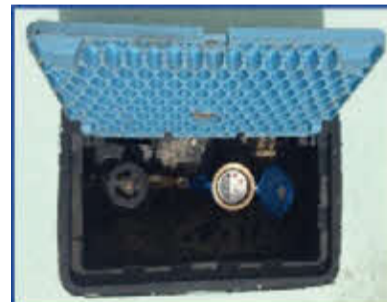
水道メーターボックス