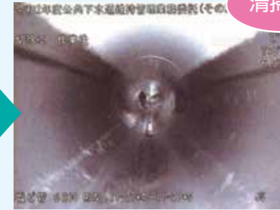
こんなにキレイになりました♪