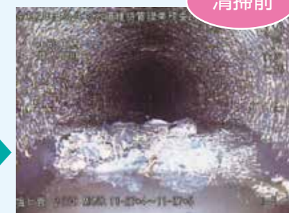
管内には土砂が・・・