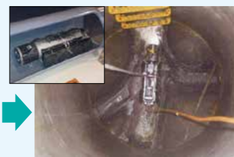
管の中をカメラで点検