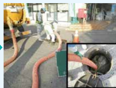
高圧洗浄車で土砂を清掃します。