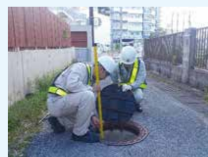
まずはチェック！ 点検ミラーで目視確認

下水道管は、家庭から流れてきた油やゴミなどが堆積することで、管が詰まる場合があります。上下水道局は、公共下水道を利用している皆様の快適な生活環境づくりのために、カメラを使って管内を点検し、異常があった際は、清掃や取替などの維持管理業務を行っています。