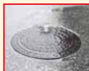
汚水があふれている状況