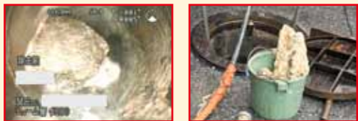
管内つまり状況の例 管内から除去された油塊の例

公共下水管内が詰まった場合には、管口テレビカメラや高圧洗浄車などの特殊な機器・機械を使用し、原因の特定・除去を行います。