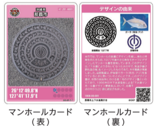
マンホールカード (表) マンホールカード (裏)