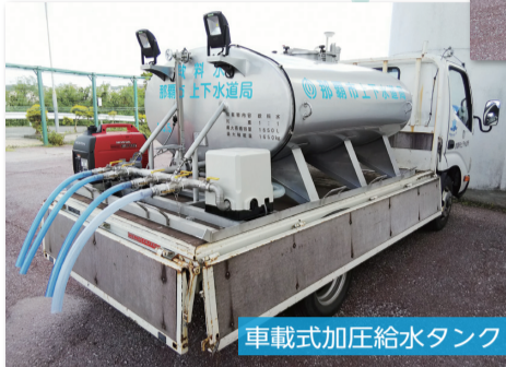
車載式加圧給水タンク

また、『災害時等における応急活動の協力に関する協定』を那覇市管工事協同組合と締結しており、災害時に必要なトラック等の資機材や人員の協力体制を確保しています。