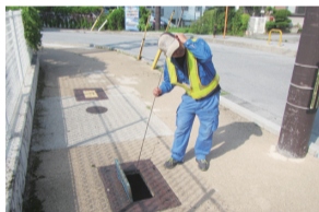
水道メーターから音を拾う「音聴棒」

上下水道局では、見えない場所で発生する漏水を探すため、音聴棒や漏水探知器で地中の音を拾い、漏水の有無を調査しています。音を聴くのは、みなさまのご家庭の水道メーターや、各所に設置された消火栓・仕切弁などの水道施設です。みなさまの漏水調査へのご理解とご協力をよろしくお願い致します。