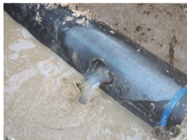
見えない場所で発生する漏水

みなさまは漏水をご存知でしょうか。たまに“〇〇の水道管が破裂”といったニュースがありますが、漏水は必ずしも地上へ出てくるものではありません。中にはホースに針を刺した程度の漏水もあります。もちろんこのような小さな漏水についても放置していいものではありません。漏水は決して眠らず、時間とともに成長します。普段は水圧がかかっているため管外の汚れが漏水箇所から浸入し水質を汚染することはありませんが、漏水が周囲の土壌を削り、地下に空洞ができる事例もあります。そうなると、道路陥没などの二次災害が起こる可能性があるため、速やかに修繕することが必要です。