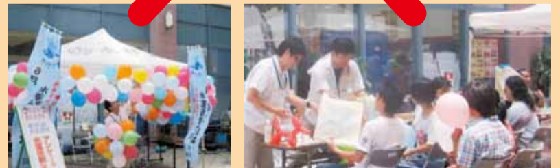
風船やグッズの無料配布も行い好評でした。(上・右)

アンケートや利き水の集計結果、ポスターコンクール入賞作品及び入賞者のコメントは上下水道局ホームページに掲載しています。 http://www.water.naha.okinawa.jp