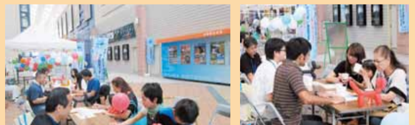
3種類の水を飲み比べる利き水にチャレンジ(左・上)