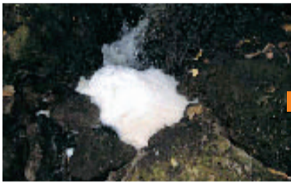
生活排水による水質汚濁が進んでいた安謝川

首里石嶺町→首里平良町→首里末吉町→安謝へと流れる安謝川は、下水道が整備されないまま流域の人口が急増したため生活排水が流入し、水質が悪化していました。市では、下水道の整備と接続への取り組みを積極的に行うなど市民と協働して安謝川の浄化活動を行い、以前は洗剤の泡が吹きあげられるほど水質が悪化していた川が今では小動物が息をするまでに改善されています。平成19年度には『第16回いきいき下水道賞(国土交通大臣賞)』を受賞することもできました。これまでの下水道接続への取り組み、市民が主体になった清掃活動や環境学習が安謝川を改善できた原動力です。