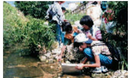
子どもたちが川の生き物を調査