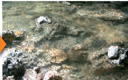
水質改善後の安謝川