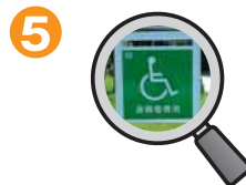
身障者専用駐車場(5台)

来客者はご利用になった窓口に必ず駐車券をご提示ください。 ※大型車は車高に気をつけて! 車高制限 2.3m以内