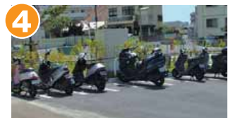
来客者専用の二輪置場