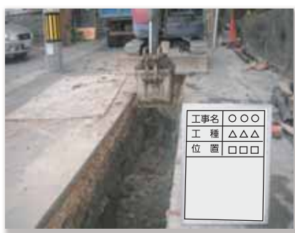
① 工事のための掘削状況

道路に埋設されている水道管が古くなると、管内に鉄さびが発生し、それが原因で赤水がでたり、漏水しやすくなります。 また、大きな地震が起こると、壊れたり、継ぎ手が抜けたりして漏水が起こり、市民生活に不可欠な水を送れなくなります。 そのため、水道管を地震に強い耐震管へと取替えています。