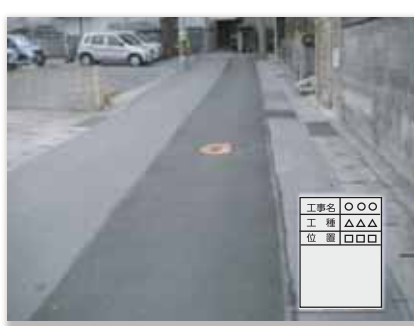
⑤ 工事が完了した状態