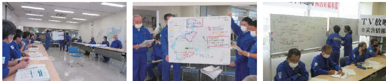
災害対策本部会議

上下水道局庁舎での訓練では、「職員の参集訓練」にはじまり、各班（総務・配水運用・管路復旧・応急給水・下水道）や応援協定団体が連携し、「災害対策本部の設置運営訓練」、「応援協定団体への応援要請訓練」、「応急計画の策定訓練」等を実施しました。