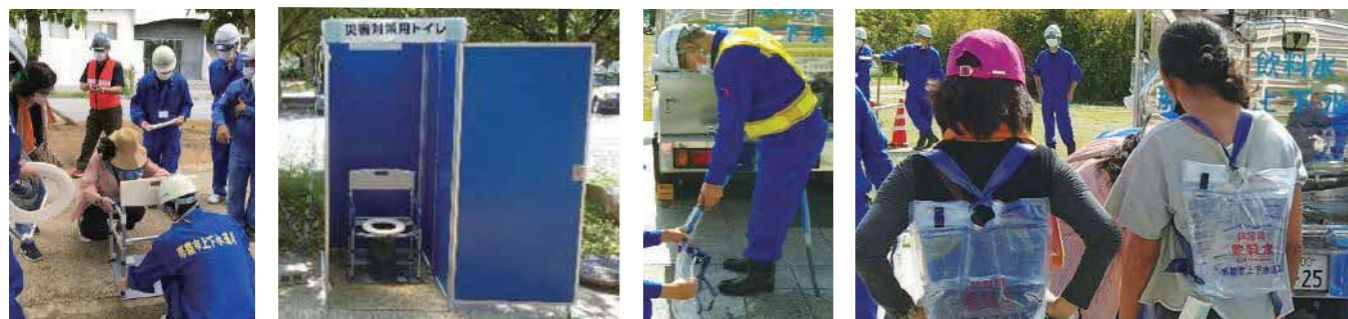
マンホールトイレ設置訓練

新都心公園では市民参加型の訓練を計画し、応急給水車や公園の地下にある緊急貯水槽を使用し給水袋へ水を入れる「応急給水訓練」、マンホールの上にトイレを組み立てる「マンホールトイレ設置訓練」を実施し、周辺地域の市民の皆様には災害時の上下水道局の応急復旧活動について実際に体験していただきました。