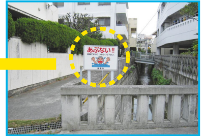
ガープ川沿いに設置された看板

現在、私たちは排水路の危険性をお知らせする看板をガープ川を中心に10か所に設置しています。