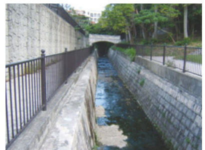
ギブンジャー川(排水路)