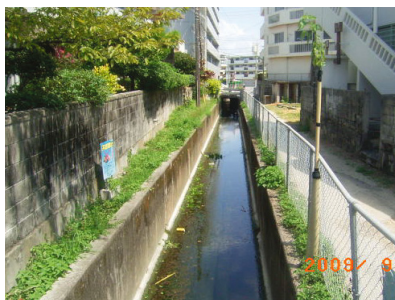
小緑2号幹線(排水路)