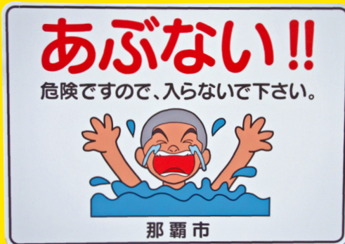
立ち入り禁止看板 (拡大)