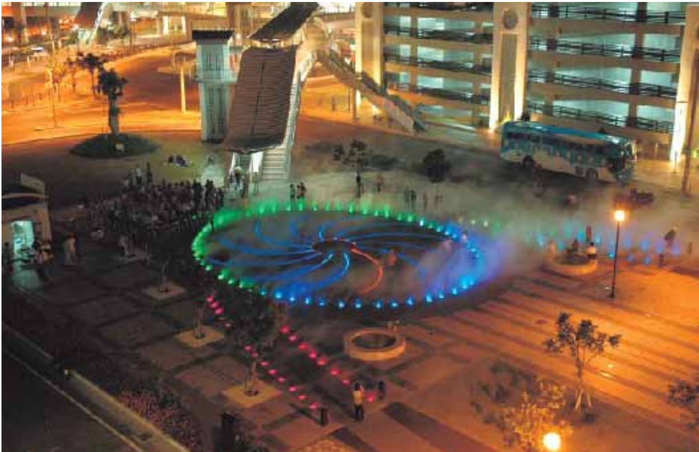
那覇新都心おもろまち駅前の「霧の噴水」