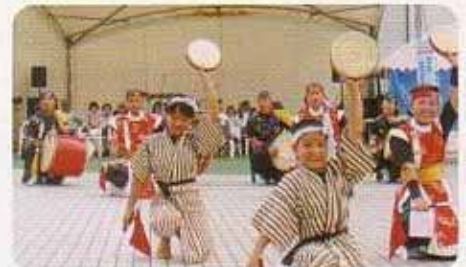
子供たちによるエイサー演舞