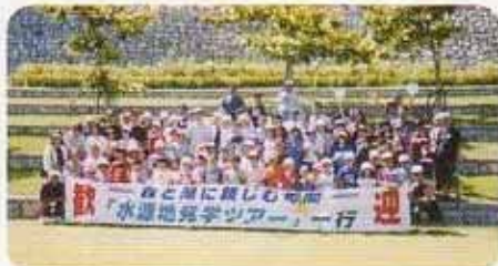
水源地親子エコツアー (東村民の森つじエコパークにて)