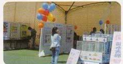
第46回水道週間inパレット会場の様子