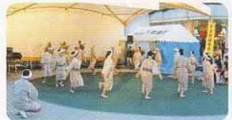
フィナーレの雨乞いクイチャー踊り