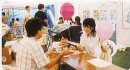
水道相談コーナー

毎年、6月1日から7日までの1週間は水道週間です。普段何気なく使っている水道、そして何より生活に欠くことのできない水道について、より皆様にご理解を深めてもらうことを目的として、全国的に各種イベントが開催されます。那覇市でも様々な催しを行い、多くの皆様に参加していただきました。