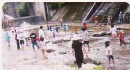
川遊びの様子(福地川にて)