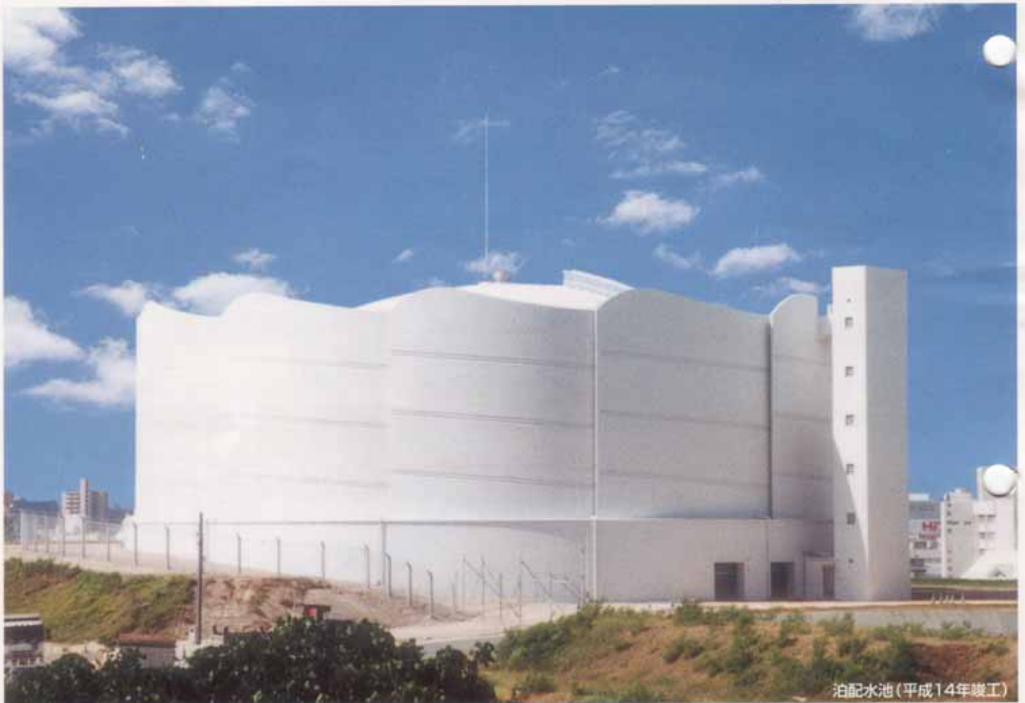
泊配水池(平成14年竣工)