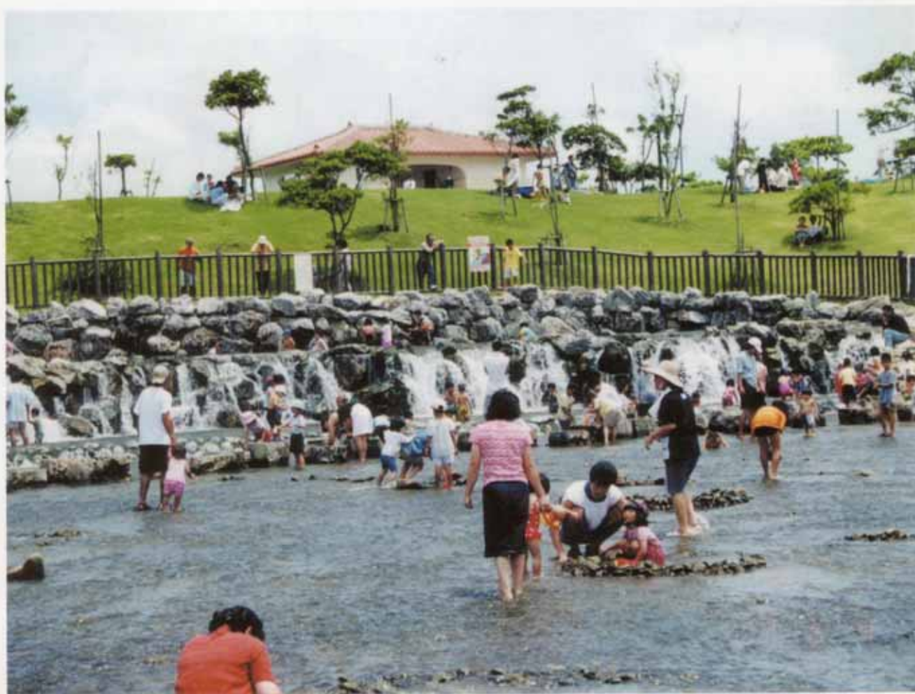
(倉敷ダム内水遊び場)