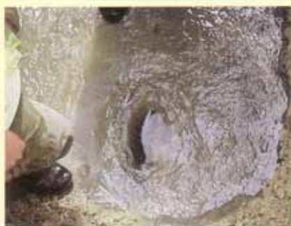
道路などの地下に埋められ ている水道管の漏水状況

パッキンなど簡単な修理は、その場で行います。大きな修理が必要な場合は、水道修理業者を紹介します。 ※漏水は放っておくと、たいへんです。地盤沈下などを引き起こす原因ともなります。