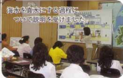
海水を真水にする過程について説明を受けました。

この水道施設見学は、水道モニターの皆さんに水道施設を見学してもらい、各家庭に水道が届くまでの過程を勉強してもらおうと開催しました。