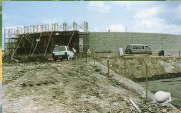
安里配水池建設現場

このパースは、 当年度の予算で建設される安里配水池です。 周辺の居住環境を考慮して、設計されており、有効容量は、一万三千三百立方メートルで、新都心及び近隣地区への給水を目的として建設されます。