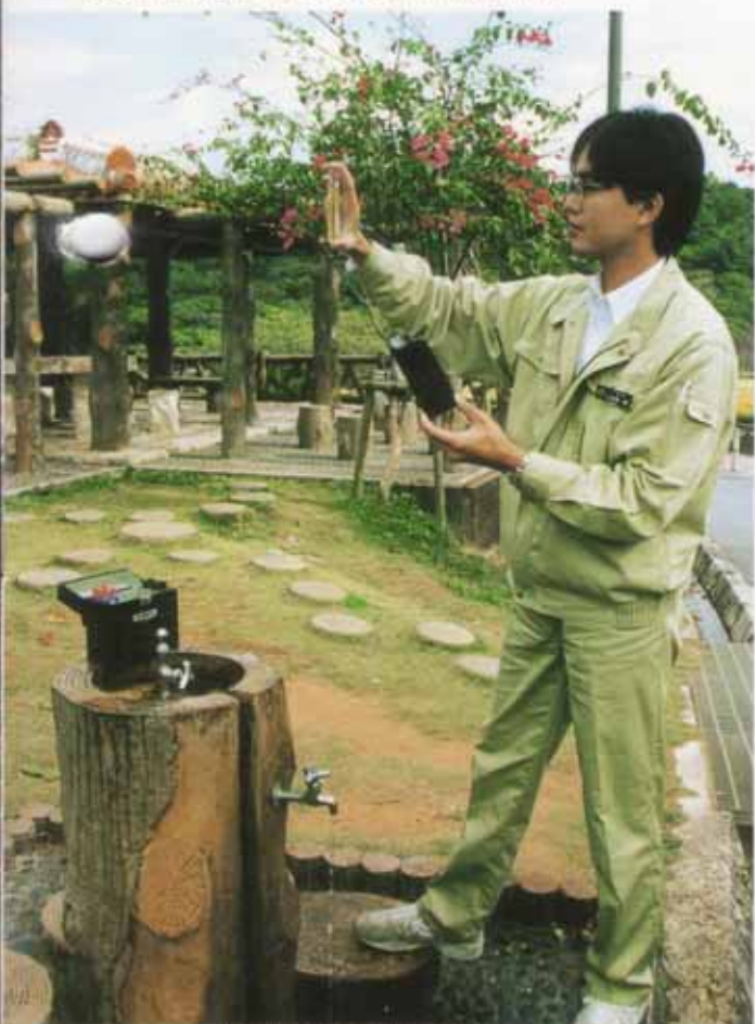
毎日水質検査のための採水

それらの項目のうち、日々変化するもの（濁りや色、味、細菌等）については、毎日検査を行い、長期的に変化し得ないものについては、三カ月に一回検査を行っております。