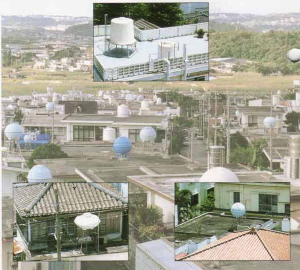
いたる所に見られる屋上貯水タンク

又、安全で美味しい水を飲むためには、常に水の流れを良くし、滞留しないようにすることです。市民からの水質調査の依頼は夏場に多く、貯水タンクの清掃不良、貯水の滞留が水質異常の主な原因となっております。