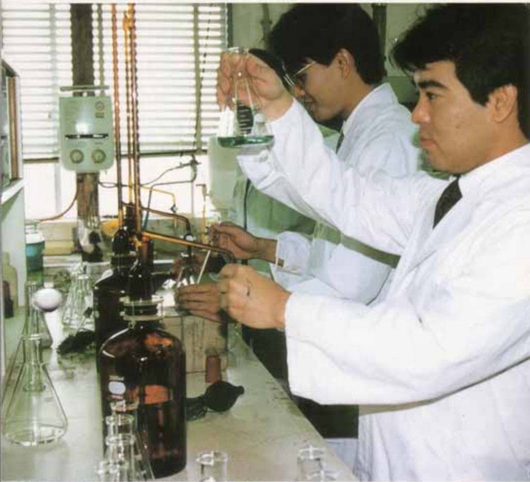
水質試験所で検査を行う職員（那覇市水道局）