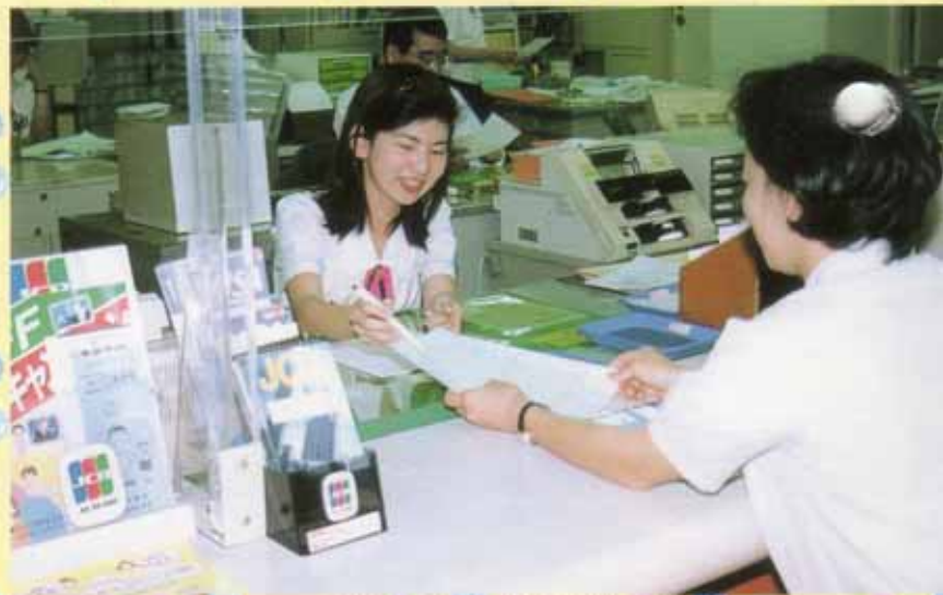
口座振替の申込は各金融機関の窓口で

家の増改築のときに水道メーターボックスが床下や屋内にならないようにしてください。