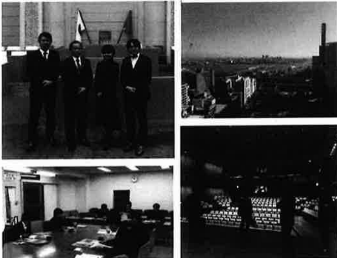
上：神戸市 左下：尼崎市 右下：可児市文化創造センターalaにて