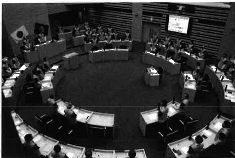
平成 31 年那覇市議会 2 月定例会開会日： 読売巨人軍キャンプ歓迎でオレンジユニフォームを着用