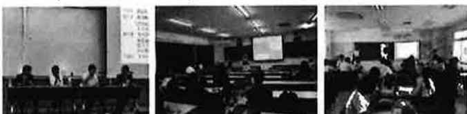
左：日本地方政治学会（大東文化大学） 中央：琉球大学にて

より政治を身近にわかりやすく伝えようと、母校・那覇高校で試みた、市政県政で実際に議論されている「奥武山公園陸上競技場へのサッカー専用(J1規格)スタジアム建設と陸上競技ニーズへの対応」をテーマとしたワークショップは好評。生徒の反応から、主権者教育で「本物の政治に触れる」ことの大切さを再認識しました。(写真右)