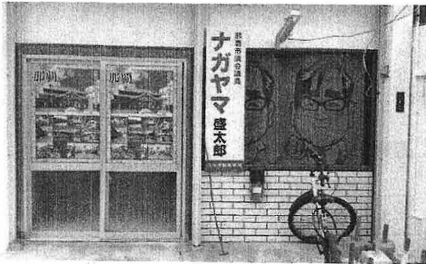
政治活動事務所入り口