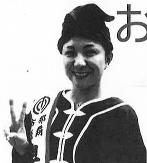
那覇市議会議員 奥間 綾乃