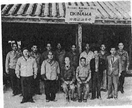
沖縄諮詢会のメンバー

沖縄諮詢会 おきなわしじゅんかい 戦後沖縄最初の中央政治機構。*米軍政府の諮問機関として1945年(昭和20)8月20日、石川市においてスタートし、以後46年4月に*沖縄民政府が創設されるまで米軍政府と沖縄住民の意思の疎通をはかる機関として機能した。*沖縄戦が一段落を告げ、*ポツダム宣言受諾によって日本の無条件降伏が決定した45年8月15日、すでに米軍占領下にあった沖縄では、米軍政府によって石川市に各収容地区の住民代表からなる仮沖縄人諮詢会が招集され、席上、米軍政府側から沖縄諮詢会の設置と米軍政府の統治方針が発表された。この声明のなかで米軍政府は、同諮詢会の委員を15人とし、選出にさいして以下のような条件を