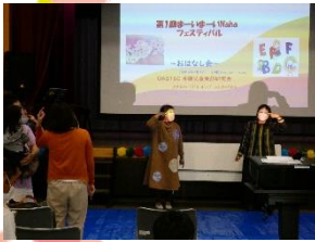
OASTEC(沖縄児童英語研究会) のみなさんによる手遊び

3/12(日)に「第1回まーいまーいNahaフェスティバル」が開催されました。2階のホールでは、OASTEC(沖縄児童英語研究会)と仲井真中学校読み聞かせボランティアすみれの会のみなさんによるおはなし会が行われました。