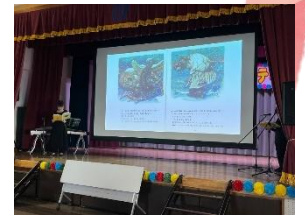
すみれの会のみなさんによる ウクライナ民話『てぶくろ』