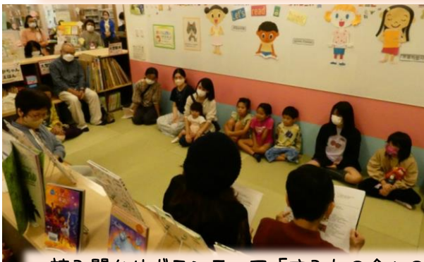
読み聞かせボランティア「すみれの会」の皆さん、楽しい時間をありがとう！