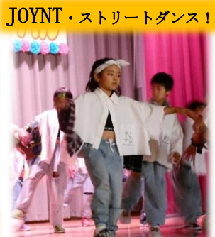
JOYNT・ストリートダンス!