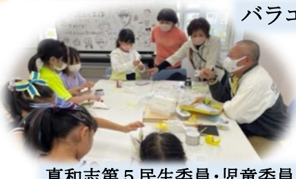
真和志第5民生委員・児童委員 「手作りおもちゃ工作」