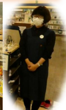
図書室児童書担当・かなこさん