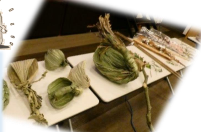
自然の素材を生かし、生活に根付いた様々な道具 の数々。改めて先人達の知恵に感動しました。