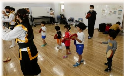
那覇青年育成連合会・エイサー体験