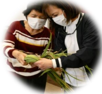
1人ずつ丁寧に教えて くれました。