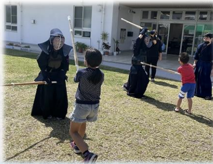
琉志館・青空の下「剣道体験」