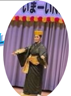
前川美智子琉舞道場