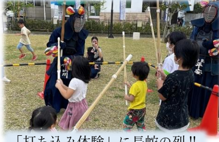
「打ち込み体験」に長蛇の列!!