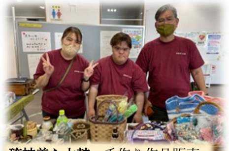
琉神美ら太鼓・手作り作品販売