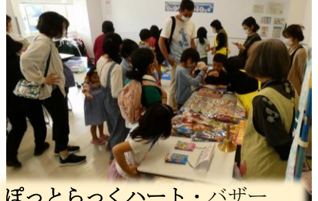
ぽっとらっくハート・バザー