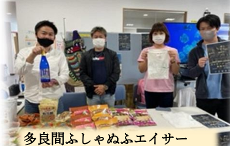
多良間ふしゃぬふエイサー 多良間特産品・黒糖最高です！