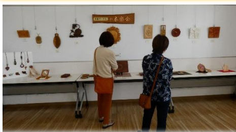
木彫りサークル「お木楽会」作品展