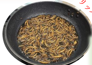
ミールワーム(甲虫の幼虫)