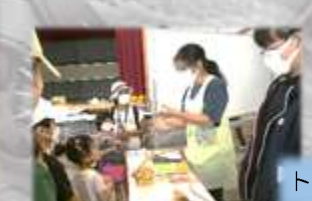
トカケとふれあい