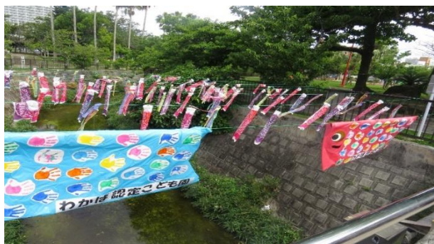
←→ わかば認定こども園の子どもたちの作品