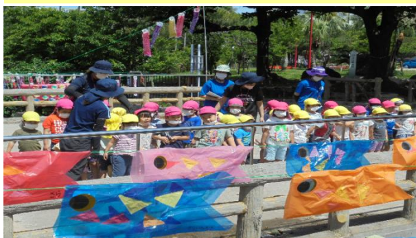
←→ みやぎ原保育園の子どもたちの作品

しばらくは、子どもたちの作品が公園を訪れる人々の心をさらに癒してくれそうです。どの子も“那覇市の宝”スクスクと育ちますように～