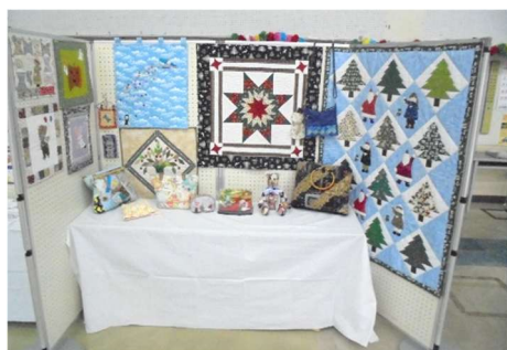
パッチワークサークル・キルトビー

展示作品はどれも力作揃い!皆さんの頑張りが伝わってきます。またサークル展示の他に、環境政策課による「環境パネル展」も行われ、那覇市の環境に対する取り組みを紹介しました。