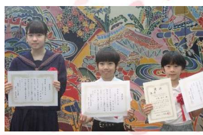
第1回那覇市図書館を使った 調べる学習コンクール表彰