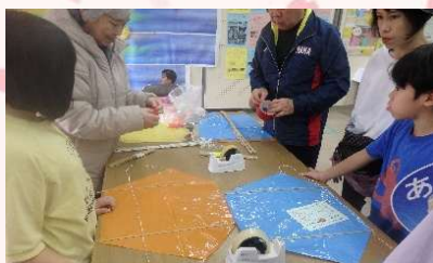
凧作り・おもちゃ作り