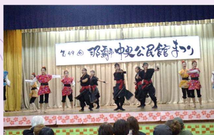
那覇青少年舞台プログラム