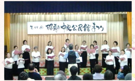
女声合唱団「シャイニー」