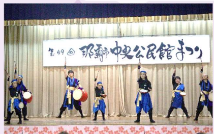
創作エイサー隊「天之川」