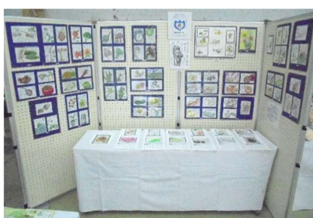
絵手紙サークル「結」