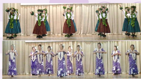
ハワイアンフラ・サークルプアケア