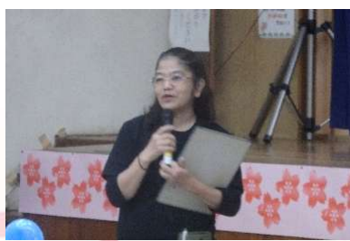
中央公民館利用団体連絡協議会 奥平会長あいさつ