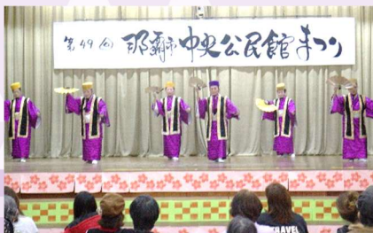
琉舞サークル花すみ会