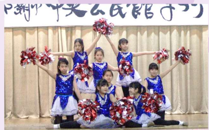
エヴァダンシア与儀