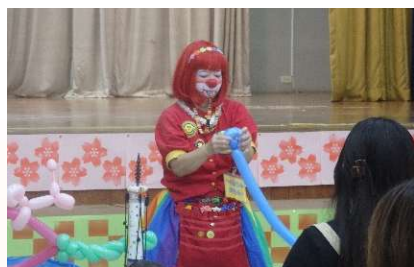
オープニング クラウンきらら・バルーンショー