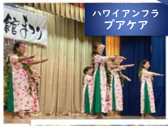
ハワイアンフラ プアケア