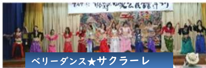
ベリーダンス★サクラレ