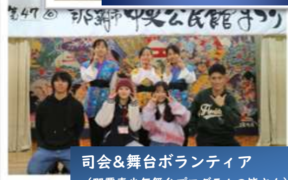
司会&舞台ボランティア (那覇青少年舞台プログラムの皆さん)