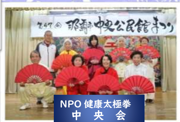
NPO 健康太極拳 中央会