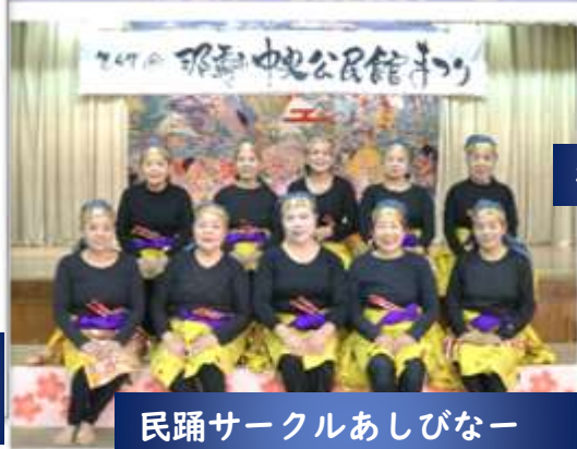
民踊サークルあしびなー