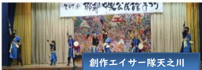
創作エイサー隊天之川