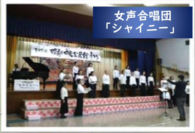
女声合唱団 「シャイニー」