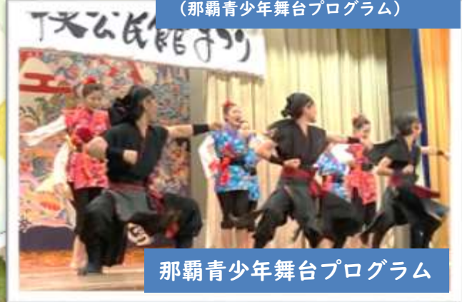
那覇青少年舞台プログラム