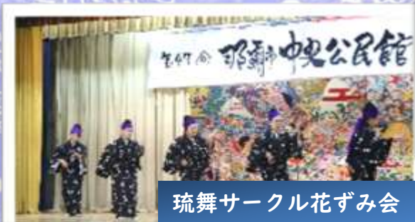
琉舞サークル花ずみ会