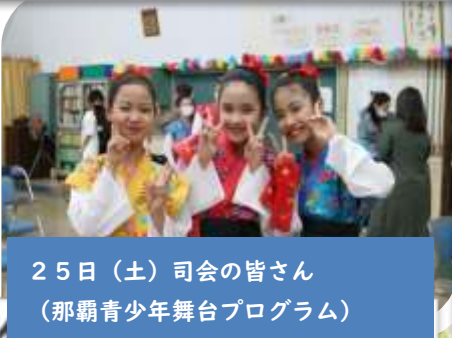
25日(土)司会の皆さん (那覇青少年舞台プログラム)