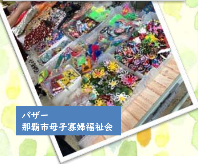
バザー 那覇市母子寡婦福祉会