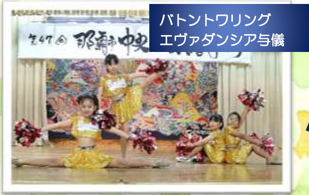
バトントワリング エヴァダンスア与儀