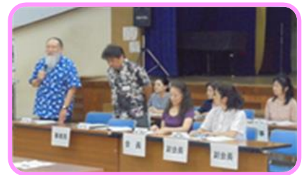
H30利用団体連絡協議会総会