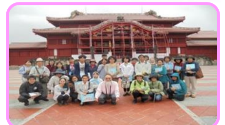
利用団体交流会 in 首里城