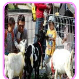
第42回 中央公民館まつり