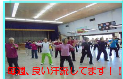
毎週、良い汗流してます!!

「水心会」は今年1月に活動を開始しました。「水心」とは、「水の中心」のことです。「水」は、岩盤にも穴をあけるほど強いにもかかわらず、みずから場所を選ぶこともなく、常に高い所から低い所に流れ込み、汚い所であろうともすべてを浄化してしまふ。「水」は分け隔てなく全てを受け入れ、浮力を働かせて水紋を形成します。太極拳も同様、相手の力に抵抗することもなく、いつでも無理なく勁力を発揮できるようになることを目指しています。そのため、24式と推手という基本に特化した練習になります。