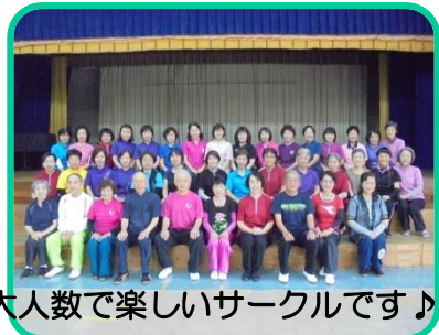
大人数で楽しいサークルです♪

「水心会」は今年1月に活動を開始しました。「水心」とは、「水の中心」のことです。「水」は、岩盤にも穴をあけるほど強いにもかかわらず、みずから場所を選ぶこともなく、常に高い所から低い所に流れ込み、汚い所であろうともすべてを浄化してしまふ。「水」は分け隔てなく全てを受け入れ、浮力を働かせて水紋を形成します。太極拳も同様、相手の力に抵抗することもなく、いつでも無理なく勁力を発揮できるようになることを目指しています。そのため、24式と推手という基本に特化した練習になります。