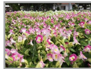
与儀公園内 満開の花

那覇市中央公民館 那覇市寄宮1-2-15 TEL 098-917-3442 FAX 098-835-4707