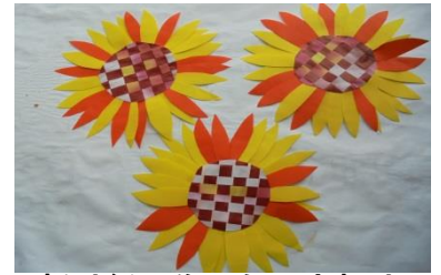
折り紙で作ったひまわり

那覇市中央公民館 那覇市寄宮 1-2-15 TEL 098-917-3442 FAX 098-835-4707