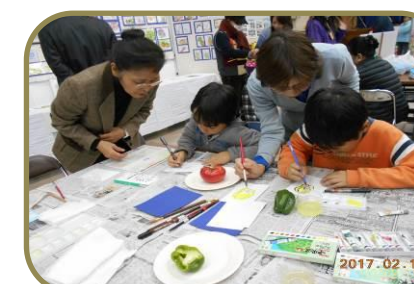
公民館まつり（体験コーナー）