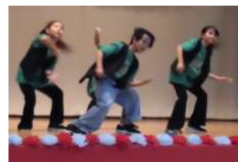
「カッコいい」 極めポーズで エイヤー！