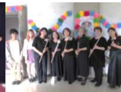
小鳥がさえずるように♪