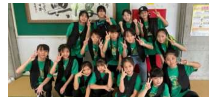
ダンス 楽しいね！ 笑顔でピース