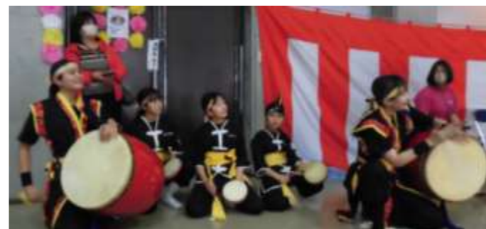
エイサー 楽しいね!