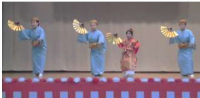
【舞鶴】 オープニング かぎやで風