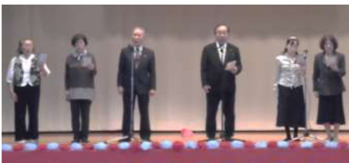
【那覇西吟友会】詩 吟