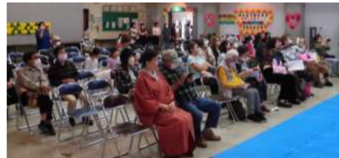
観客席は見物客でいっぱい