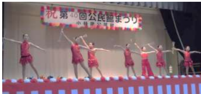
【小祿バトン】バトントワーリング