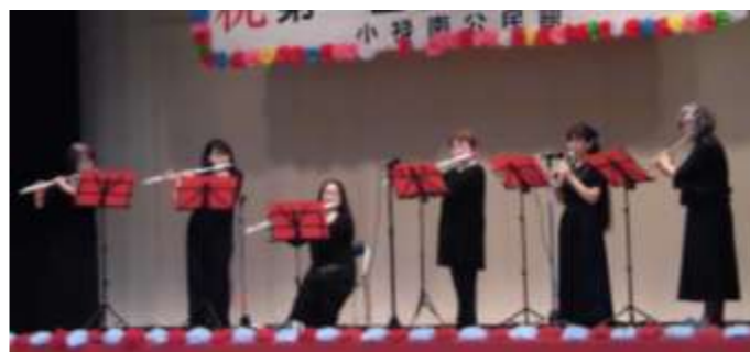
【フルート・オカリナ・ルヴァン】