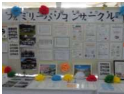
【ファミリーパソコンサークル】