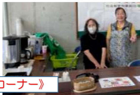
【社会教育指導員OB会】