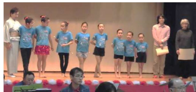
小祿バトンさん 10周年 おめでとう!