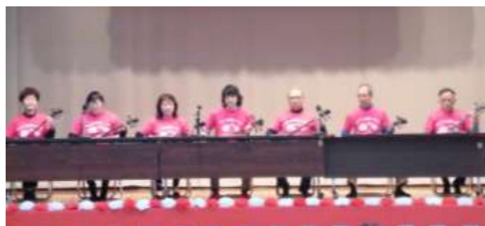
【ロハス三線サークル】