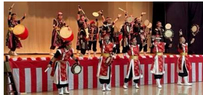
【那覇太鼓】創作エイサー