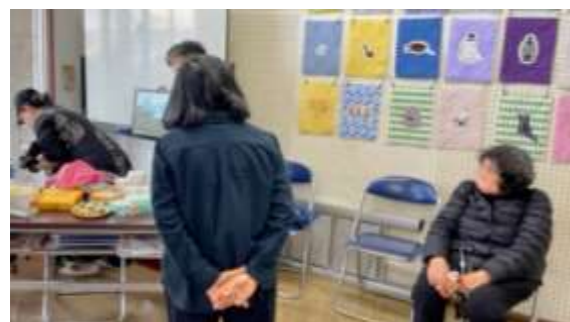
【遊友パッチワーク】