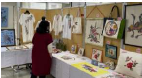
【小祿紅型サークル】