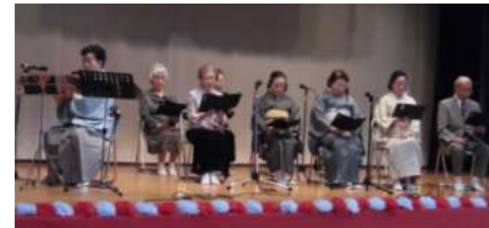
【観世流 松風会】謡曲