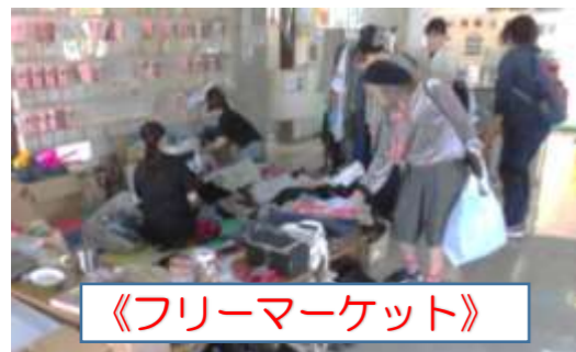
《フリーマーケット》