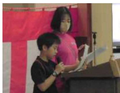
司会者さん よく頑張った！