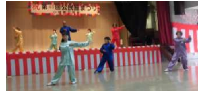
【健康太極拳サークル】