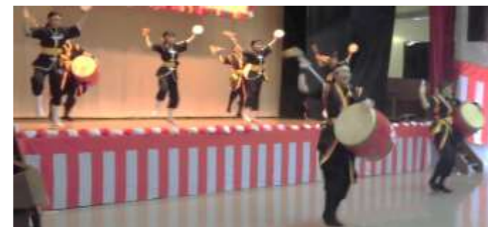
【若鷹太鼓】エイサー