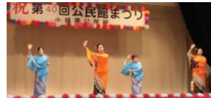
【きさらぎの会】日本舞踊（西川流）