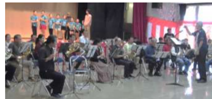
【吹奏楽団「楽・奏」】表彰式の演奏