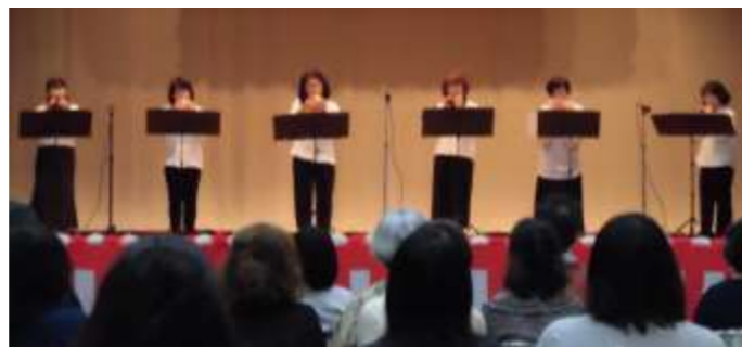
【オカリナサークル 「オアシス」】