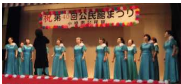
【小祿女声コーラスみなみ】