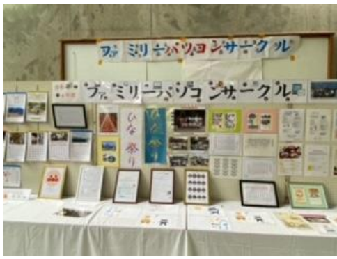
【ファミリーパソコンサークル】