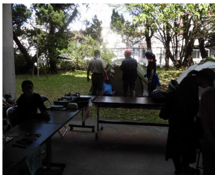
【ボーイスカウト那覇1団】