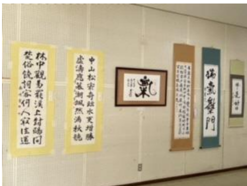
【玄海書道サークル】