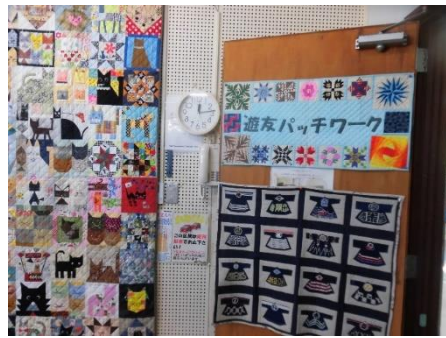
【游友パッチワーク】

5つのサークルさんの素晴らしい作品が公民館まつりを盛り上げてくださいました。どの作品もサークルのレベルを遥かに超えた素晴らしい作品ばかりでした♪