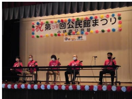
【ロハス三線サークル】

各サークルさん共に元気に 笑顔で楽しくサークル活動を されています。 サークル見学や新規入会を お待ちしております。 お気軽に窓口、各サークルさんへ お問い合わせくださいね♪