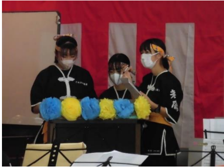
【舞台発表司会の皆さん】

11日・12日の2日間、13サークルの皆さんが舞台発表でまつりを盛り上げてくださいました。皆さん、日ごろの練習の成果が十分に発揮されて素晴らしい発表でしたよ♪