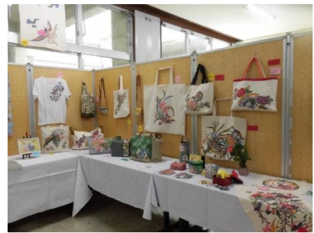
【小祿紅型サークル】