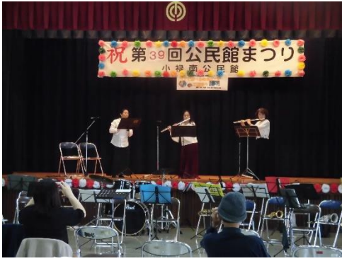
【フルートオカリナ ル・ヴァン】