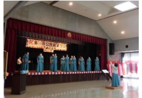
【小祿女声コーラスみなみ】