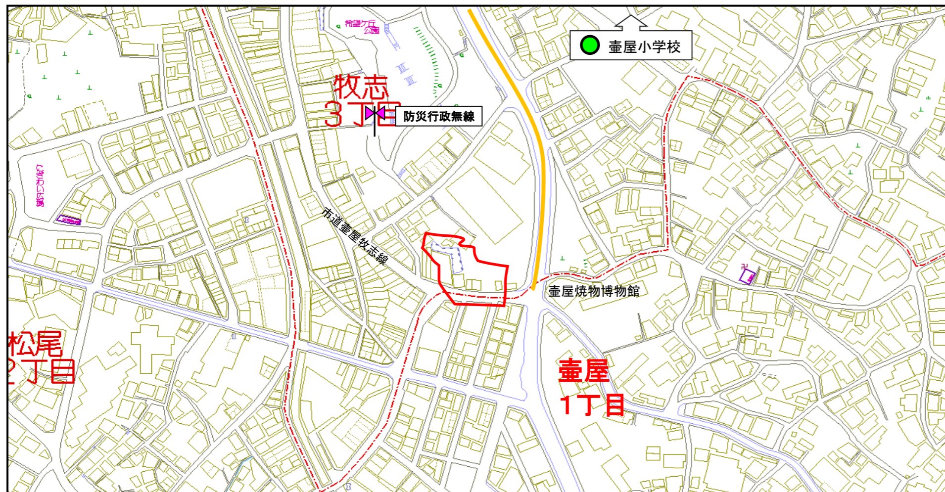
© 2014 ZENRIN CO., LTD. (Z15FC第163号)