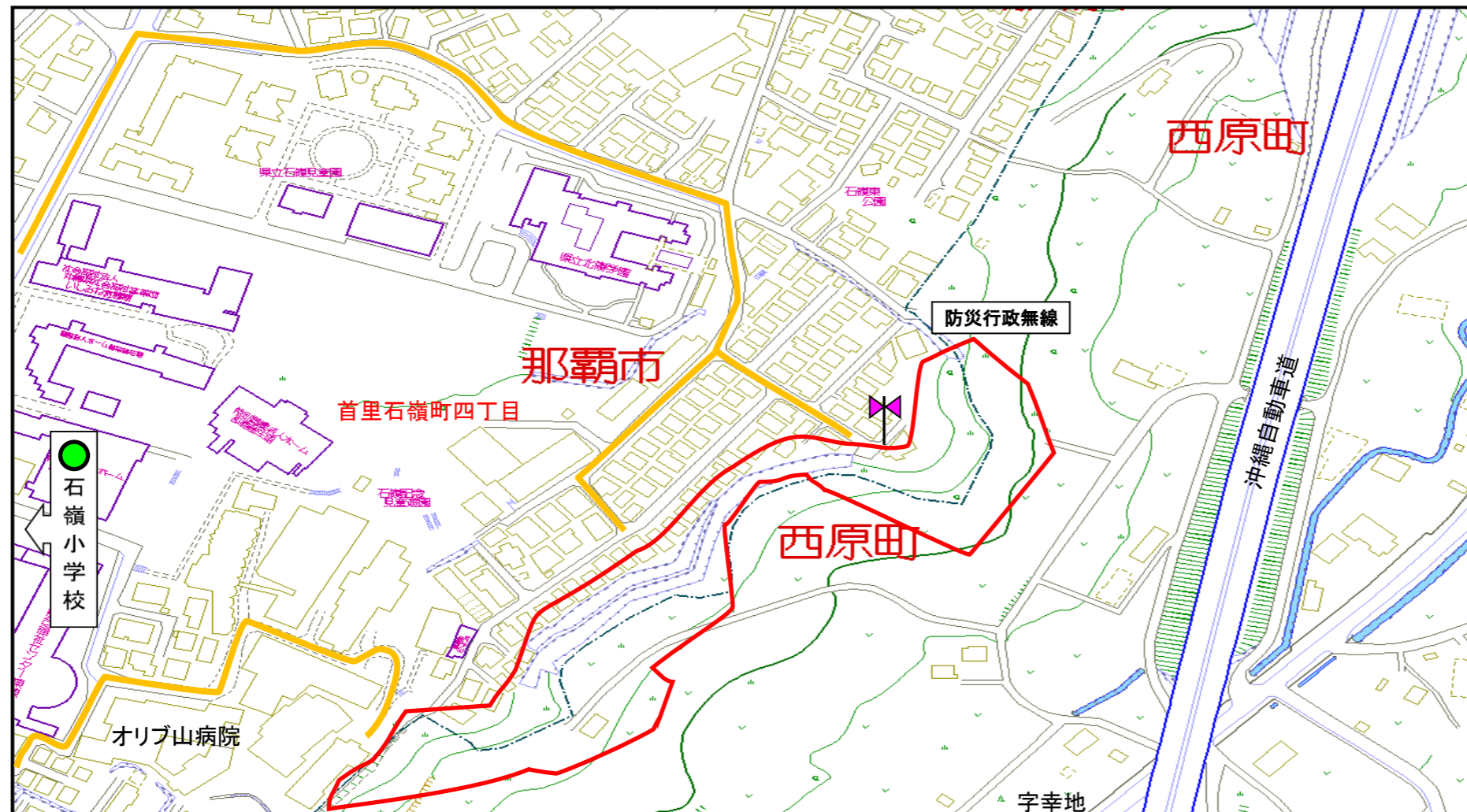
© 2014 ZENRIN CO., LTD. (Z15FC第164号)