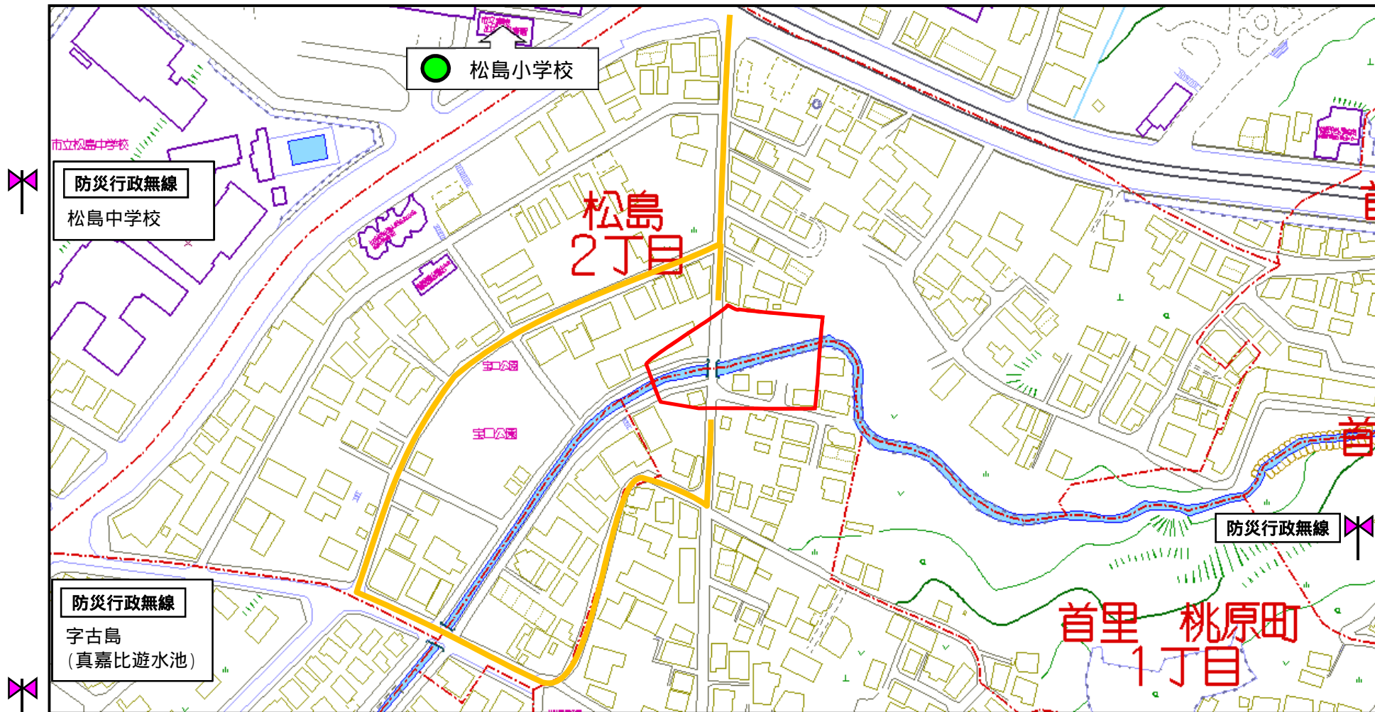
© 2014 ZENRIN CO., LTD. (Z15FC第164号)

このマップに関する問い合わせ先 那覇市 総務課 市民防災室 電話(098)861-1102 住所 〒900-8585 沖縄県那覇市泉崎1丁目1番1号 ホームページ http://www.city.naha.okinawa.jp/kakuka/bousai/index.html 土砂災害警戒区域に関する問い合わせ先 沖縄県 土木建築部 海岸防災課 電話(098)866-2410