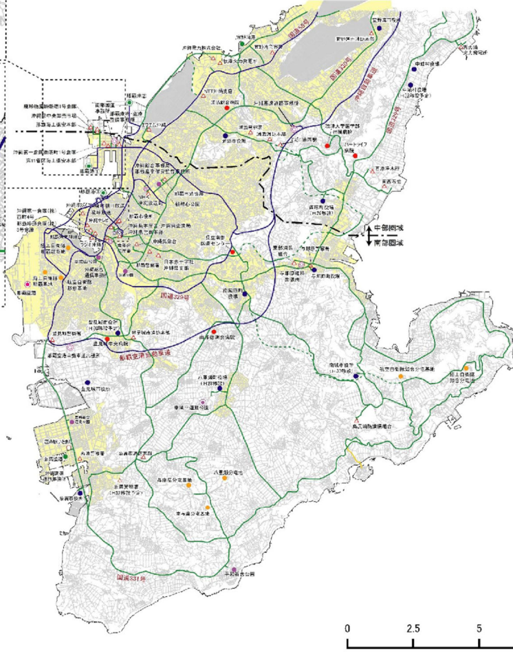
(資料：H31.2沖縄県緊急輸送道路ネットワーク計画)