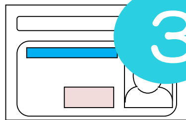
本人確認書類のコピー