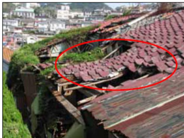
柱、はりの破損や変形が著しく崩壊の危険がある例