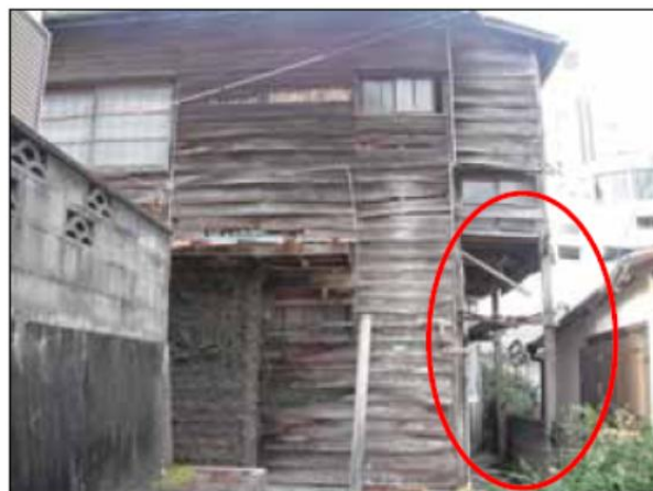
柱の数箇所に破損がある例

不良住宅の判定は、まず市職員が空家等の状態等について聴き取りし、不良住宅に該当する可能性が高いと判断した場合に、現場調査を実施して判定します。