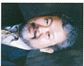
なほエコネットワーク会長