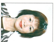
那覇市環境部部长