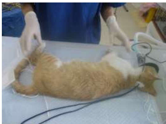
【獣医師による手術の様子】

その後、本市獣医師による不妊去勢手術を行い、手術後に当該猫を生息していた場所へ戻す作業を行っています。