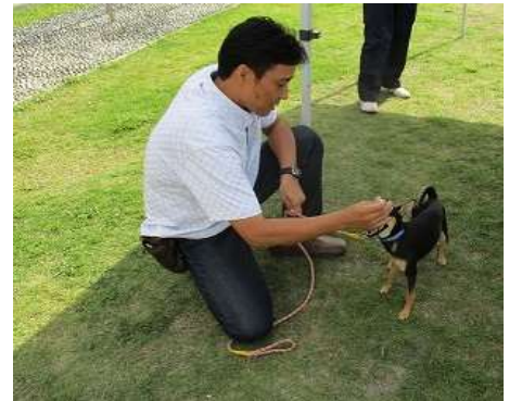
【なは動物愛護フェスタ】