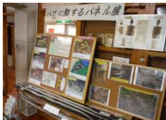
【ハブに関するパネル展】