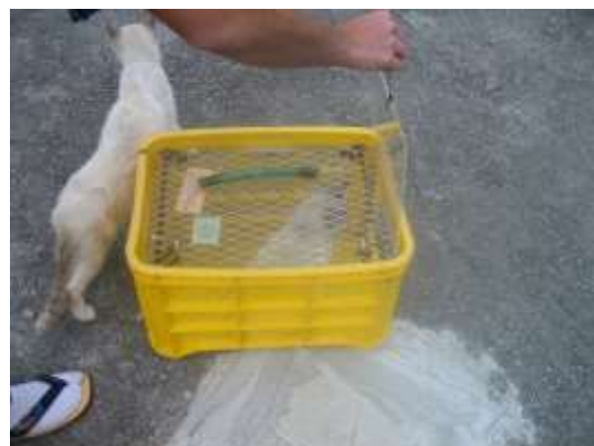
【手術後のリリース】