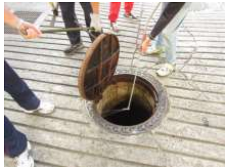
【自治会による薬剤散布】