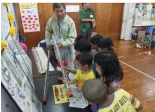
【ハブに関する出前講座】

学校や公共施設において、ハブ被害の予防対策を目的とした講座やパネル展示を実施して市民生活の安全と生活環境の向上に努めています。