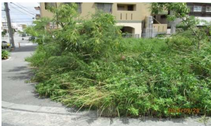
【あき地に雑草が繁茂している状態】

清潔な生活環境を維持するため、『那覇市あき地管理の適正化に関する条例』に基づき、必要に応じてあき地の所有者又は管理者に対して適正に管理するよう指導を行っています。