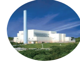
那覇・南風原クリーンセンター